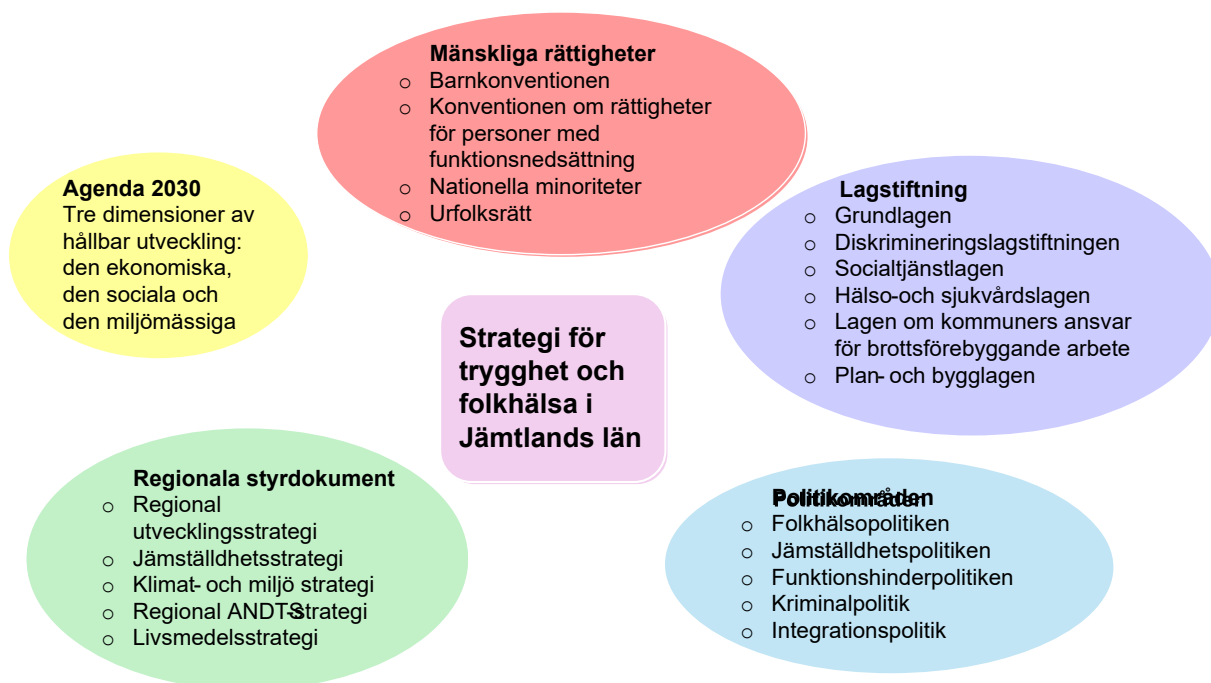
Bild 1 visar styrningen inom området för social hållbarhet och folkhälsa.

Bilden nedan visar några internationella/ nationella och regionala åtaganden på området.