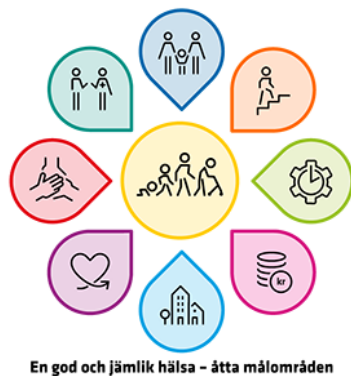
Bild 4. Folkhälsopolitikens åtta målområden.

Bilden nedan visar folkhälsopolitikens målområden som alla har påverkan på folkhälsan. Målområdena knyter an till hälsans bestämningsfaktorer.